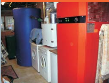
Dimplex-Luft/Luft-Wärmepumpe (vorn) 1000-Liter-Pufferspeicher

„Ich habe großes Interesse an der Brennwert-Technik und würde da gerne ein Pilot-Projekt machen“, wagt der engagierte Hauseigentümer einen Blick in die Zukunft.