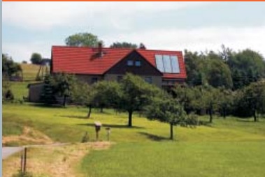
Solarthermieanlage Adamowicz Friedensweg 11 01824 Rosenthal-Bielatal

Schautafeln im Foyer des Gebäudes mit den aktuellen Parametern der Anlagen, die Beteiligung am „Tag der erneuerbaren Energien“ und außerschulische Bildungsarbeit zum Thema regenerative Energien/nachwachsende Rohstoffe sollen den Gedanken der erneuerbaren Energien weiter verbreiten.