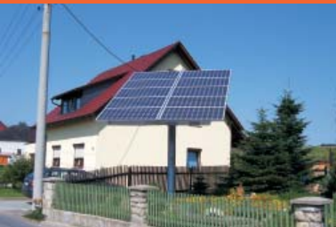
nachgeführte PV-Anlage in Helmsdorf

Im Stolpener Ortsteil Helmsdorf gibt es noch eine ganze Reihe weiterer Anlagen zur dezentralen Energieversorgung zu bewundern. Eher selten und deshalb umso interessanter ist eine nachgeführte Photovoltaik-Anlage auf der Schulstraße. Der Eigentümer ist leider selten zu Hause, so dass man sich vorerst mit der Bewunderung vom Straßenrand aus begnügen muss.