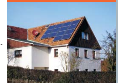
Ulrich Neuenhaus Bockmühlenstraße 81 01848 Cunnersdorf www.elektro-neuenhaus.de

Ausflugsziele in der Umgebung Landschaftsschutzgebiet Polenztal Nationalpark Sächsische Schweiz