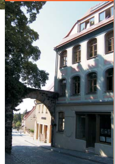
Straßenansicht des Gebäudes am Stadttor

Ausflugsziele in der Umgebung Burg Stolpen Altstadt Stadtmuseum Stadtkirche